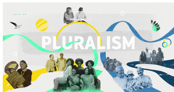
Image tirée d'une vidéo présentant LE MONITEUR MONDIAL DU PLURALISME et son site Web dans le cadre d'une campagne numérique. Cette vidéo comprend une présentation du cadre d'évaluation du Moniteur et des rapports nationaux. [MENTION DE SOURCE : SOAPBOX DESIGN]