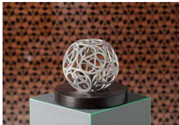
Le trophée du Prix mondial du pluralisme a été conçu par l'artiste allemand Karl Schlammingier.