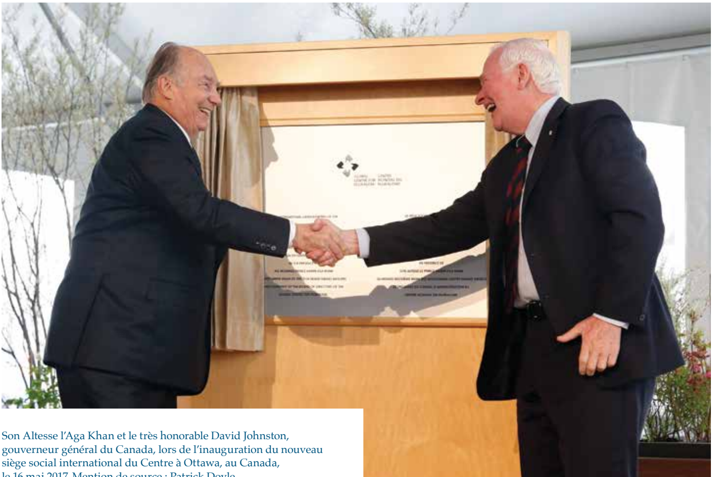
Son Altesse l'Aga Khan et le très honorable David Johnston, gouverneur général du Canada, lors de l'inauguration du nouveau siège social international du Centre à Ottawa, au Canada, le 16 mai 2017.