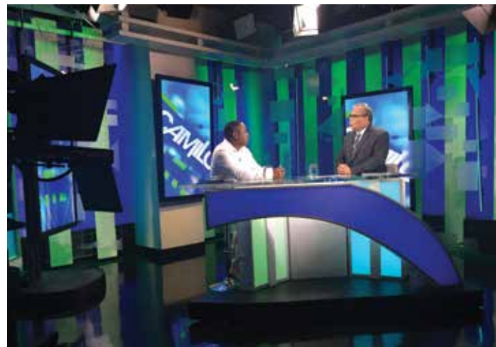
Le lauréat du Prix mondial du pluralisme Leyner Palacios de la Colombie lors d'une entrevue diffusée en direct sur CNN en Español en novembre 2017.