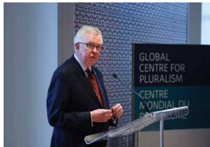
Le très honorable Joe Clark, ancien premier ministre du Canada et président du Jury international du Prix mondial du pluralisme s'adresse aux invités lors d'une réception, 6 avril 2017.