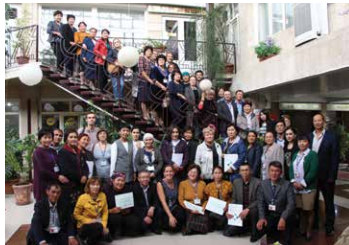
Les participants de la classe de maître au Kirghizistan « Promouvoir l'appartenance et l'inclusion dans l'apprentissage » en octobre 2017.