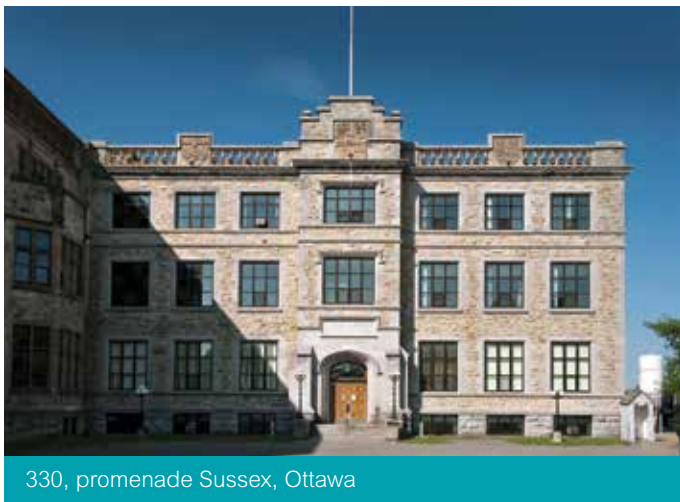
330, promenade Sussex, Ottawa

La gestion prudente des frais d'exploitation du Centre tout comme le soutien des résultats ambitieux des programmes de 2016 demeurent des priorités du Centre pour l'année à venir.