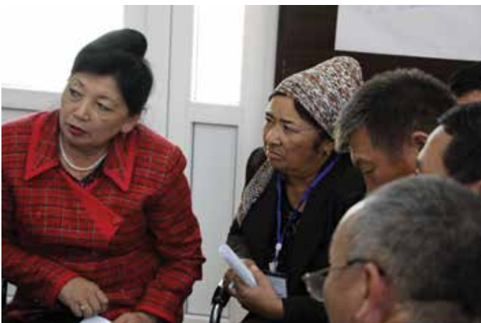
Atelier sur le pluralisme à Och, au Kirghizistan