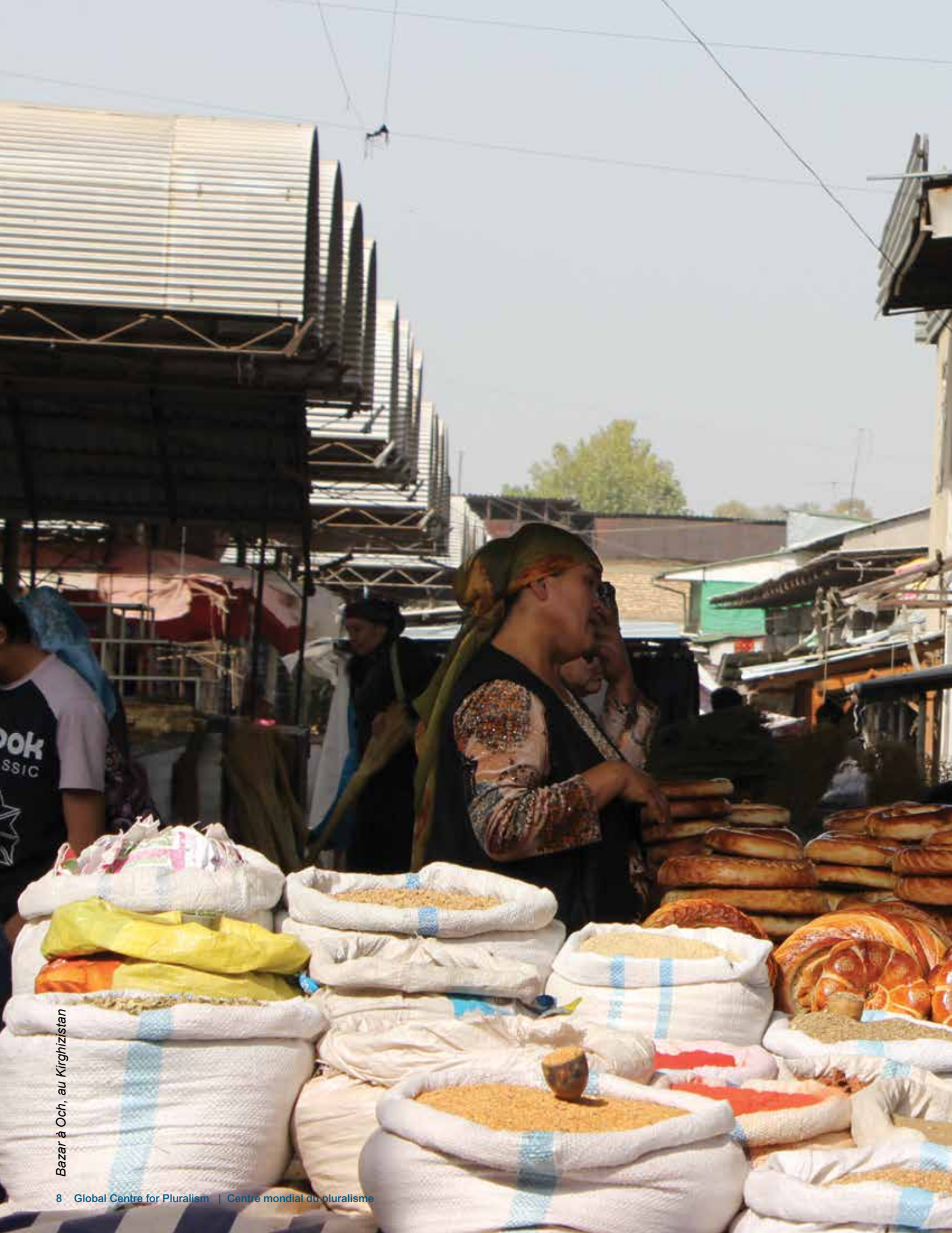
Bazar à Och, au Kirghizistan