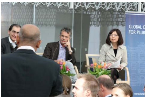
Des conférenciers et un membre de l'auditoire s'entretiennent lors du premier Forum sur le pluralisme en

L'une des priorités en 2012 fut d'élaborer l'orientation stratégique du Centre. En octobre, le conseil d'administration a approuvé un programme stratégique pour la période de 2013 à 2015, lequel définit le leadership pour le pluralisme – par le biais de l'échange de connaissances, de la portée mondiale et du dialogue – comme objectif de base du Centre.